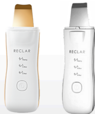
Ritual Peeler Plus 24K GOLD

Una creación magistral de Reclar, el Ritual Peeler es reconocido como un producto revolucionario en el campo de los dispositivos cosméticos. Con sus funciones principales de exfoliación y tratamiento galvanico, ayuda a restaurar la piel a su estado natural, saludable y radiante mientras se usan productos básicos para el cuidado de la piel.