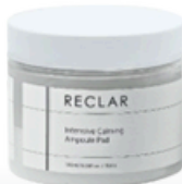
Intensive Calming Ampoule Pad 180ml / 6.08fl.oz. / 70pcs