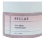
Active Cream 50ml / 1.76fl.oz.