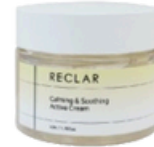
Active Cream 50ml / 1.76fl.oz.