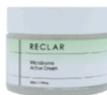
Active Cream 50ml / 1.76fl.oz.