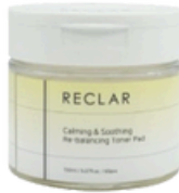
Re-balancing Toner Pad 150ml / 5.07fl.oz. / 60pcs